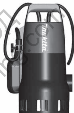
PF 0410 - PF 1010