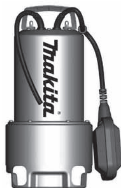
PF 0610 - PF 1110

Ташев-Галвинг ООД www.tashev-galving.com